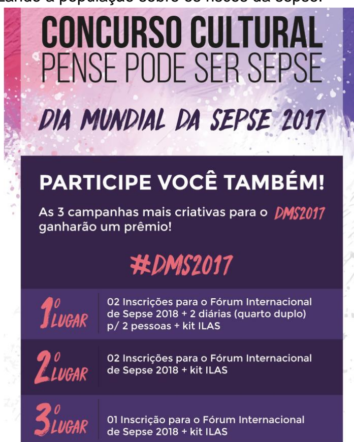
Figura 3 – Cartaz do Concurso Cultural – Dia Mundial da Sepse 2017.

O I Concurso cultural promovido pelo ILAS, para incentivar a divulgação do Dia Mundial da Sepse, contou com a participação de diversos hospitais de todas as regiões brasileiras. Foram ao todo 26 instituições, dentre hospitais e universidades, que promoveram campanhas voltadas para profissionais de saúde e/ou público em geral, conscientizando a população sobre os riscos da sepse.