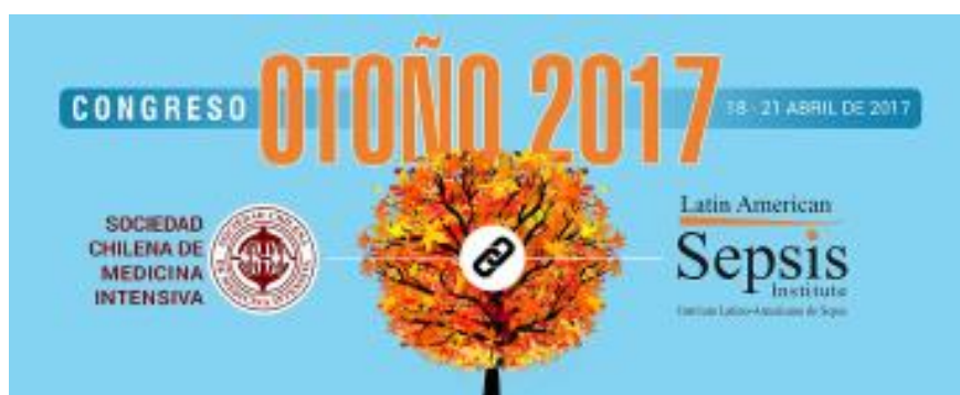
Figura 6 – Cartaz de divulgação do Congresso Otoño 2017.