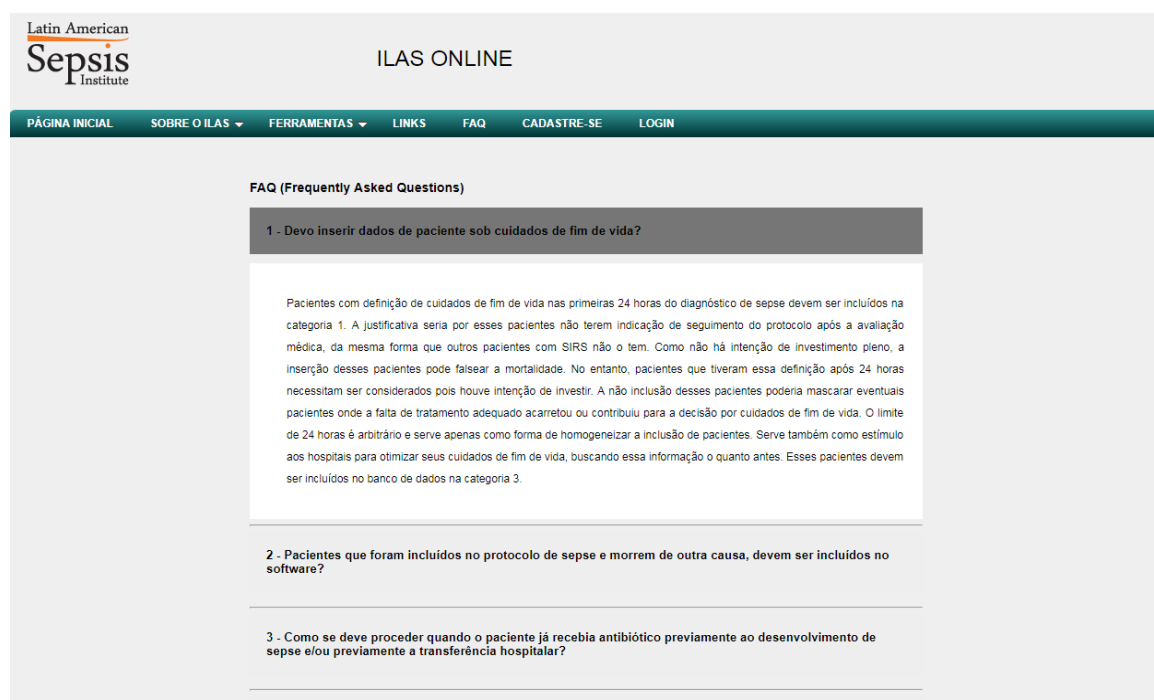
Figura 2 – Sessão de perguntas frequentes no site de coleta de dados do ILAS.